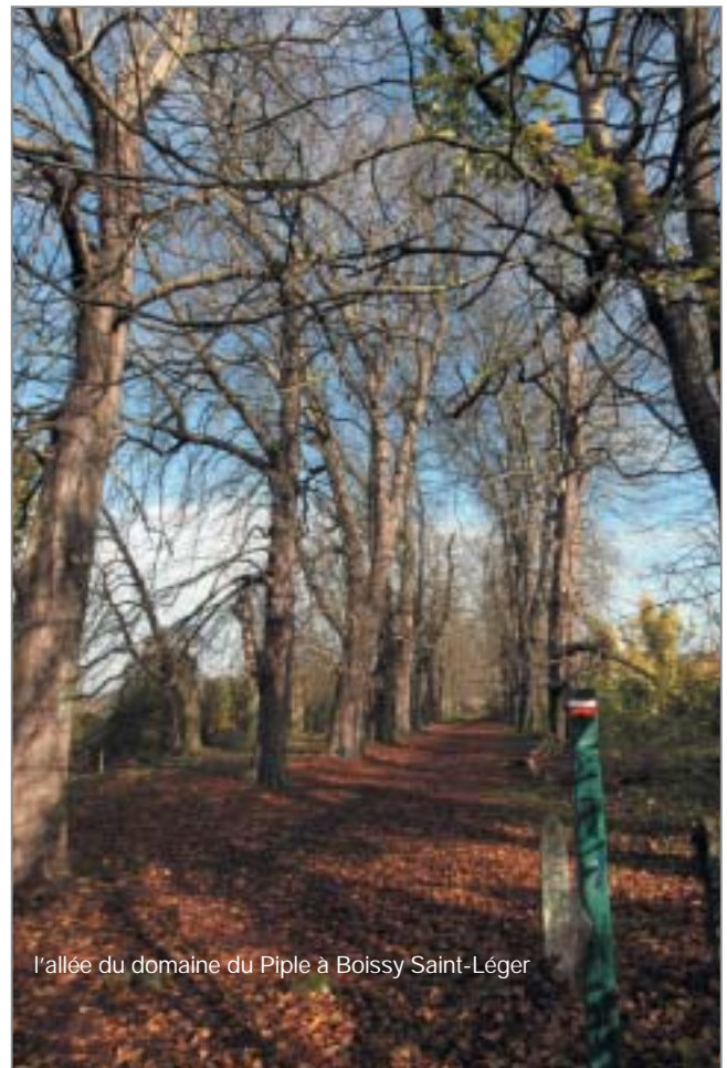
l'allée du domaine du Piple à Boissy Saint-Léger

giques : dépliants, articles de presse, information des clubs équestres, exposition itinérante sur les forêts en Val-de-Marne, guide sur les manifestations, livrets à thèmes, jeux... ■