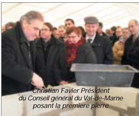
Christian Favier Président du Conseil général du Val-de-Marne posant la première pierre

Un «chantier vert» va en effet plus loin que la réglementation et véhicule des valeurs environnementales voire de développement durable (minimisation des bruits des engins, limitation par arrosage de la poussière, tri des déchets, nettoyage des véhicules sortant du chantier...) dans le but d'une réduction maximale des nuisances subies par les riverains.