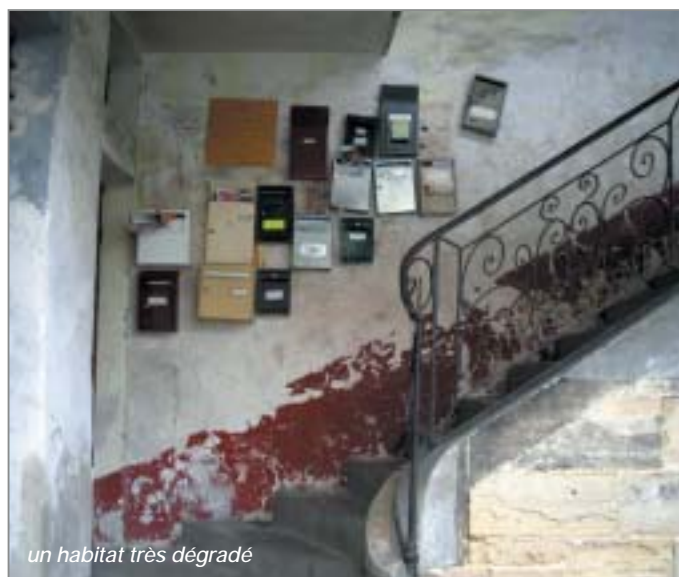
un habitat très dégradé

Dès 2010, la première tranche, de deux à trois ans, doit permettre de lancer rapidement le projet d'aménagement sur les secteurs potentiellement « producteurs » de logements (principalement les îlots Carnot, Dazeville, Lavoir et Orangerie) et les espaces publics structurants (l'entrée de ville au niveau du pont de l'Yerres, la place de la Mairie et le parvis de la gare). Cette première phase permettra également de préparer le relogement des ménages concernés). Enfin, cette étape mettra en place les dispositifs coercitifs et incitatifs d'action sur l'habitat ancien dégradé (opérations de restauration immobilière, opérations programmées d'amélioration de l'habitat, etc.).