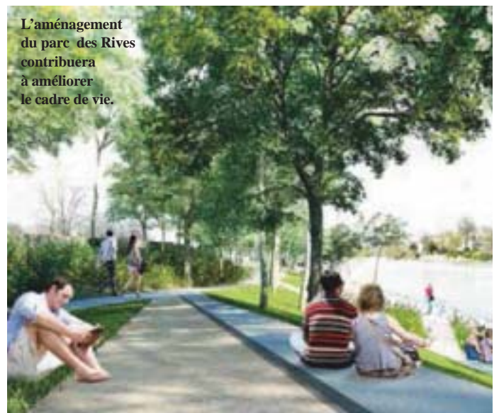
L'aménagement du parc des Rives contribuera à améliorer le cadre de vie.

Coût global des travaux : 48 M€ financés à hauteur de : - 20,8 M€ par l'Etat - 20,8 M€ par la Région Ile-de-France - 6,4 M€ par le Département du Val-de-Marne