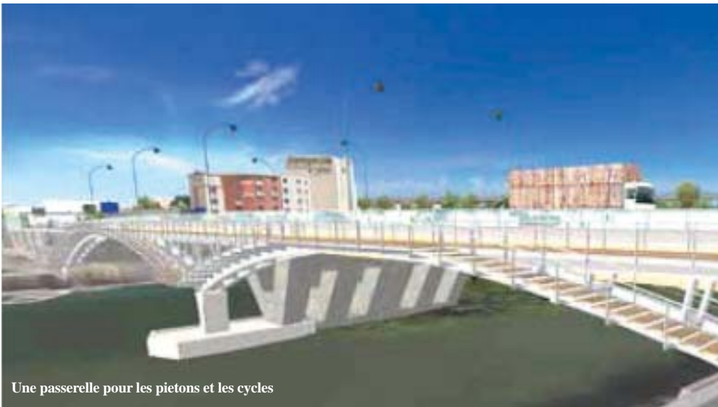
Une passerelle pour les piétons et les cycles

Les garde-corps du pont traversant la Marne seront remplacés par des dispositifs assurant une meilleure protection acoustique. Le parc des Rives sera aménagé sur les emprises de l'actuelle bretelle d'accès à l'autoroute A4 vers Paris. Il sera accessible depuis le cheminement piétons-cycles.