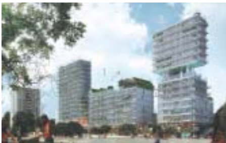
Photo : © Eiffage Immobilier / Lankry Architectes / Agence Babylone

Eiffage va construire des immeubles « posés sur socle »