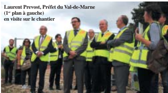
Laurent Prevost, Préfet du Val-de-Marne (1 er plan à gauche) en visite sur le chantier

Il comporte ainsi un volet routier, un cheminement dédié aux piétons et aux cycles, des aménagements paysagers ainsi que des protections acoustiques.