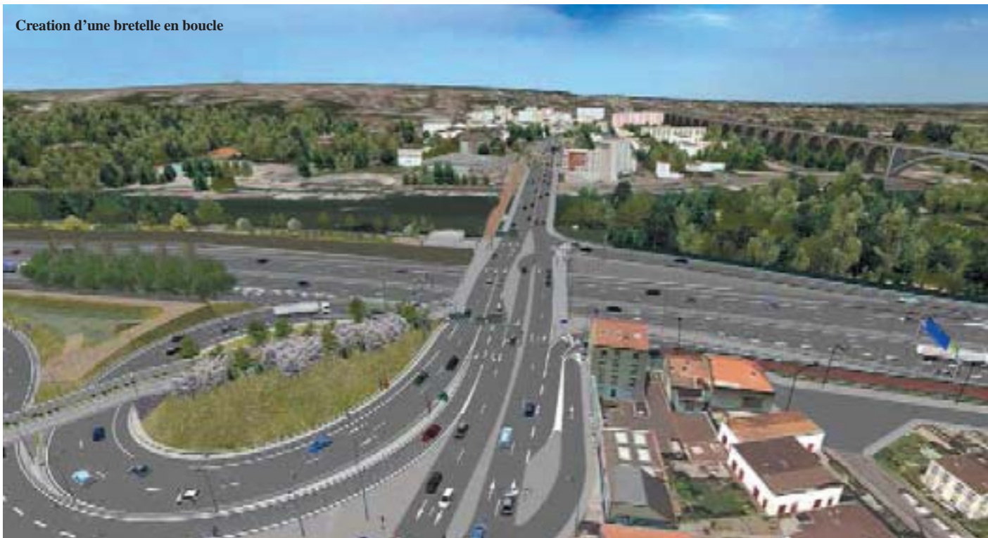
Creation d'une bretelle en boucle

Honni par les automobilistes, les habitants, les artisans, commerçants, entrepreneurs, lorsqu'ils doivent l'emprunter, le Pont de Nogent, considéré comme le plus gros bouchon routier d'Europe pourrait enfin sauter.