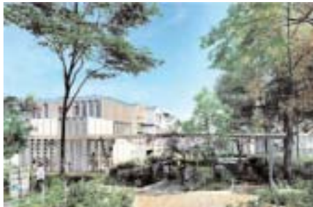
Photo : © Groupe Pichet / Nicolas Michelin & Associés / Atelier Altern

Pichet va construire un programme de 180 logements « cocon »