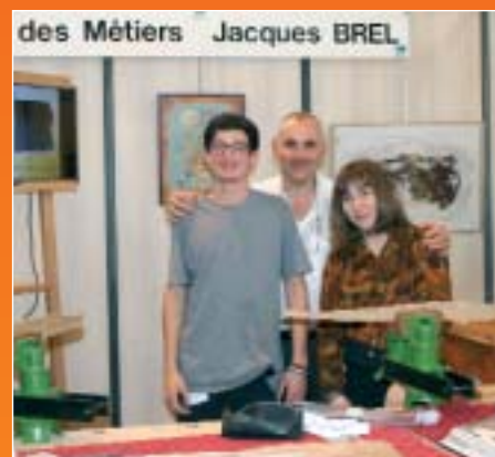
Lycée des Métiers Jacques Brel, Choisy-le-Roi