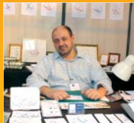
La calligraphie Dari, Vitry-sur-Seine