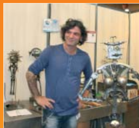
Ferronnerie Charveron, Limeil-Brévannes