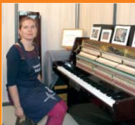
L'accord parfait, Bry-sur-Marne