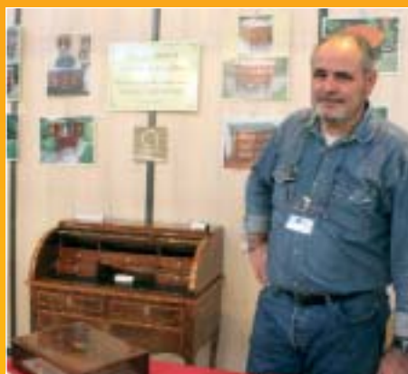
Etablissement Faroux, Villeneuve-le-Roi