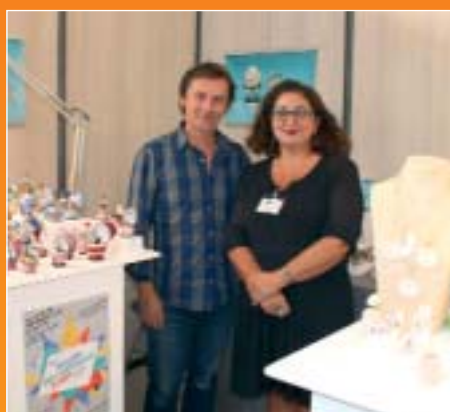
Etablissement Fanex, Fontenay-sous-Bois