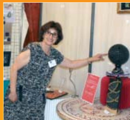
Christia Mozaïques, Saint-Maur-des-Fossés