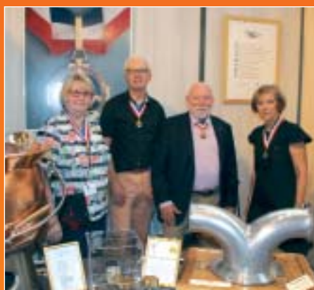
Le stand des Meilleurs Ouvriers de France